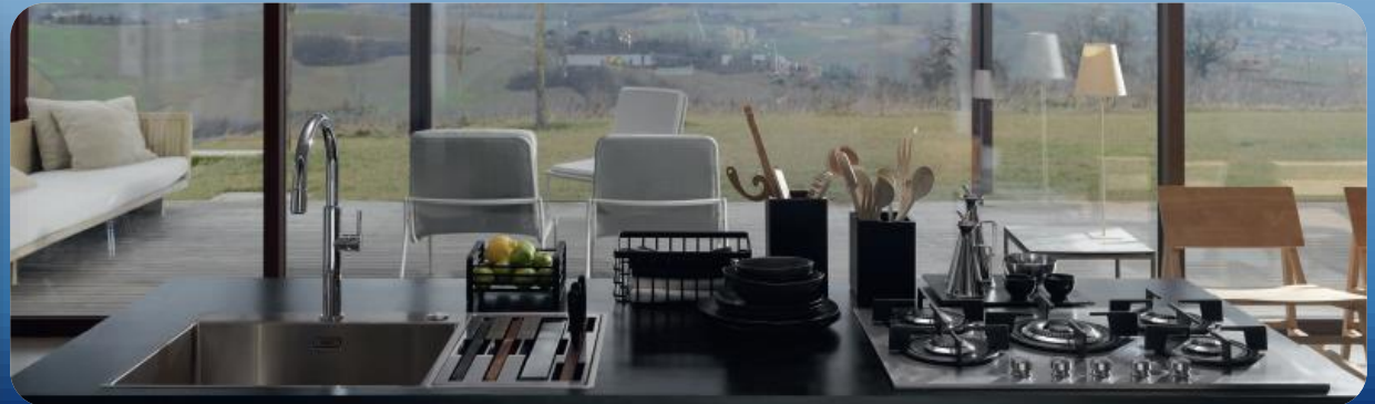
Kitchen Cabinets, Furniture & Home Appliances