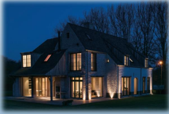
Indoor & Outdoor Lights