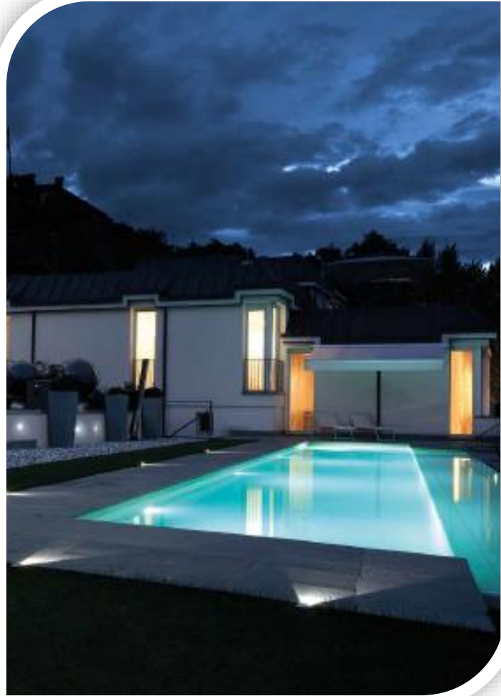
Swimming Pool Lights