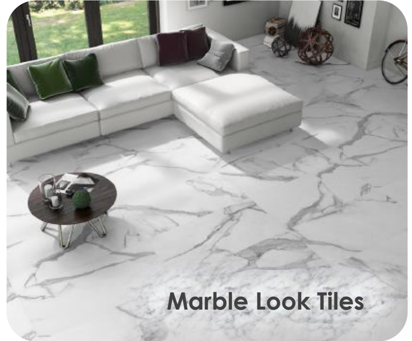
Marble Look Tiles