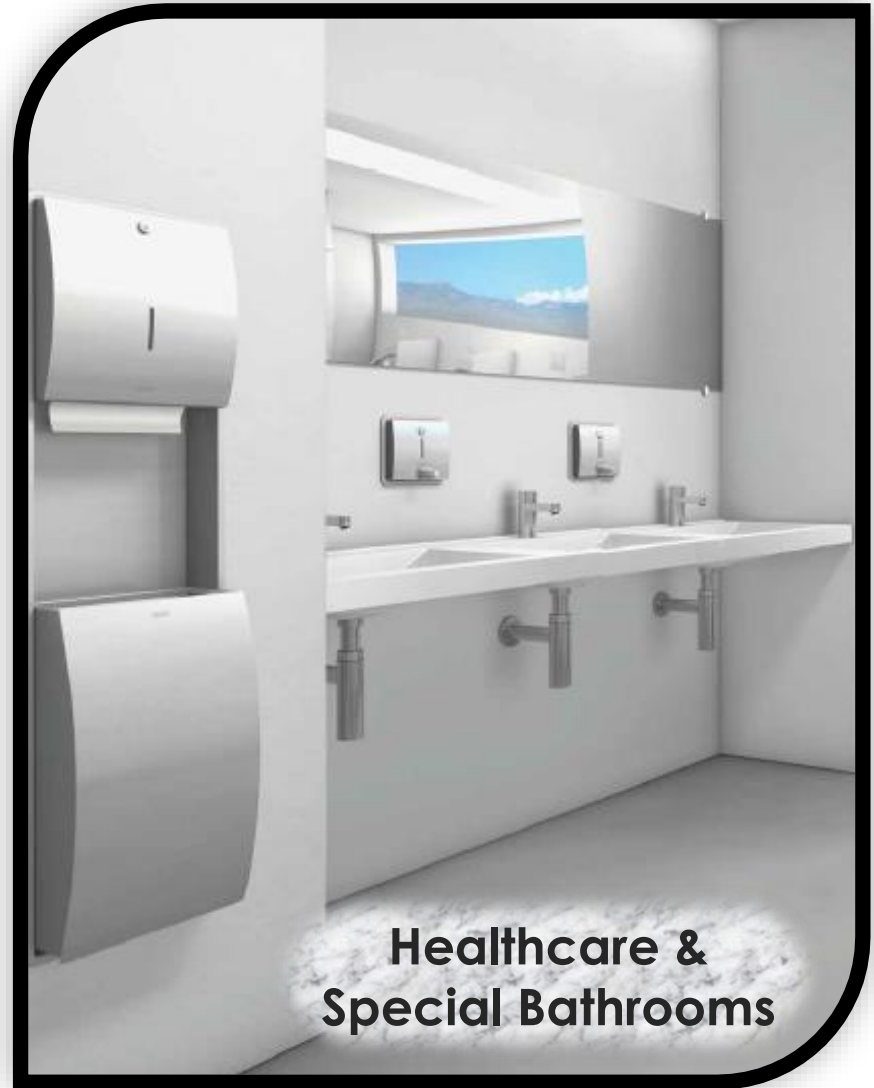
Healthcare & Special Bathrooms