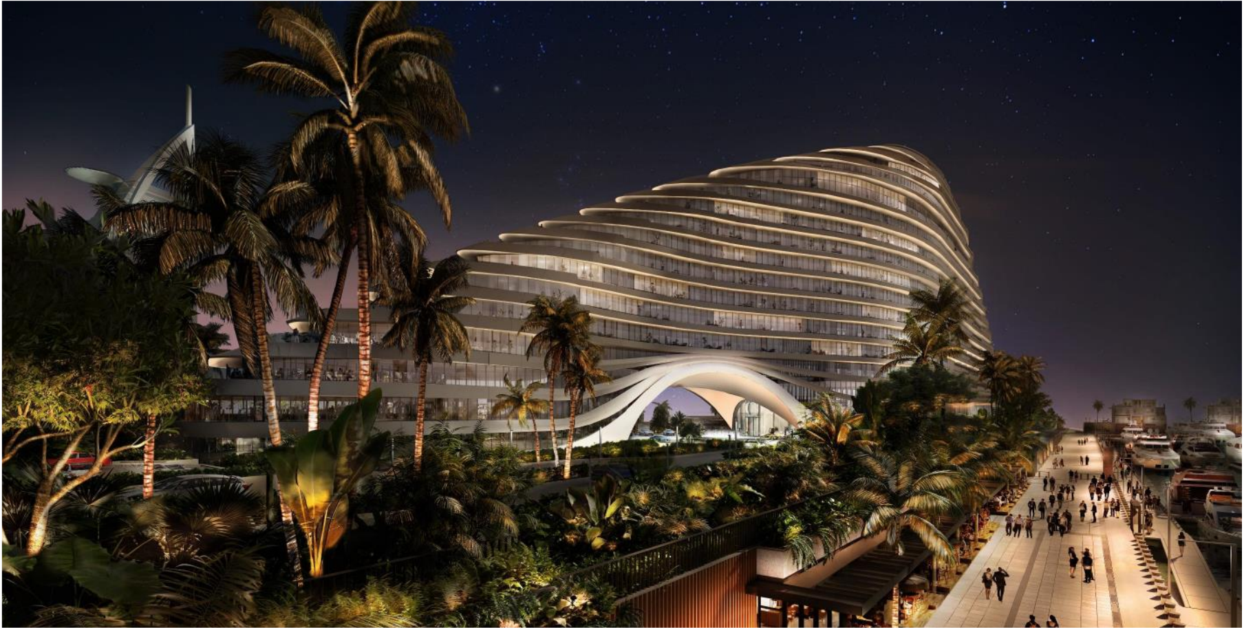
Marsa Al Arab - Five Star Hotel and Marina Extension Jumeirah Beach Hotel