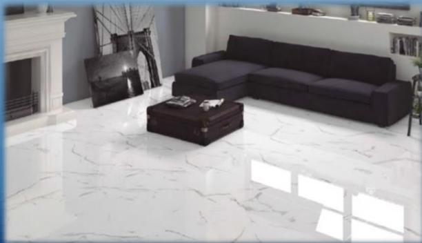
FLOOR & WALL TILES