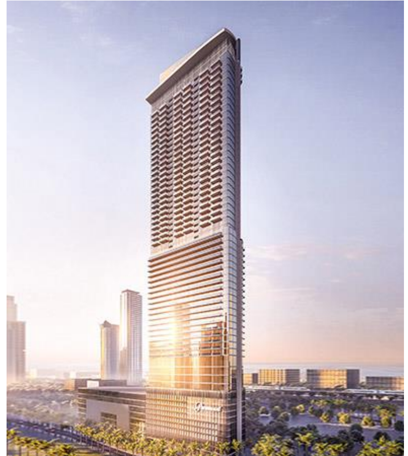
Paramount Tower Hotel & Residences