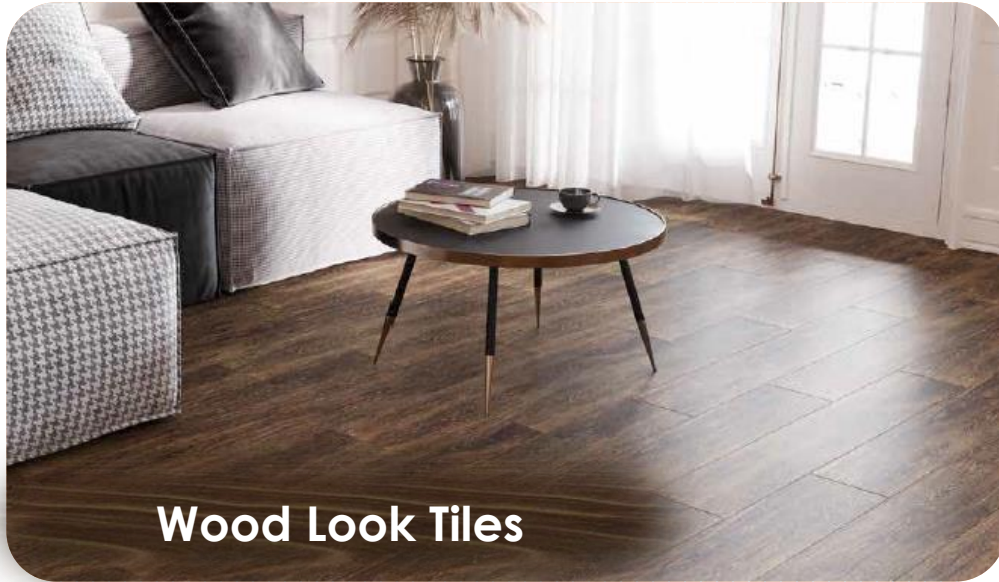
Wood Look Tiles